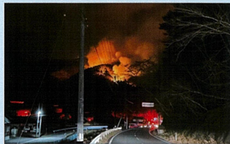
大船渡市合足地区の状況 （大船渡市林野火災を踏まえた消防防災対策のあり方に関する検討会報告書より）