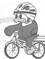
長野県警察シンボルマスコット「ライポくん」